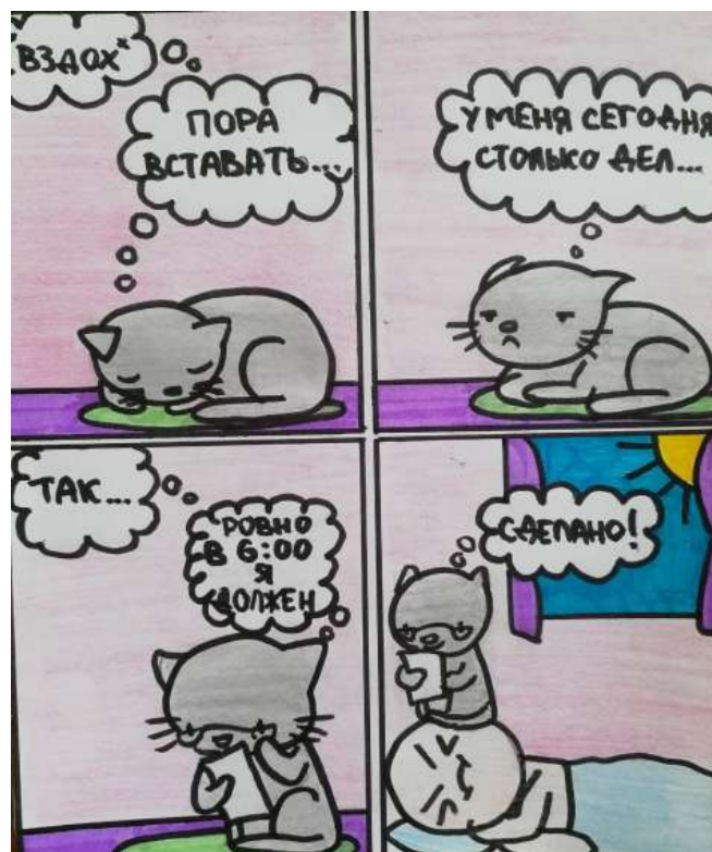
Автор: Кабанова Анастасия, 8В