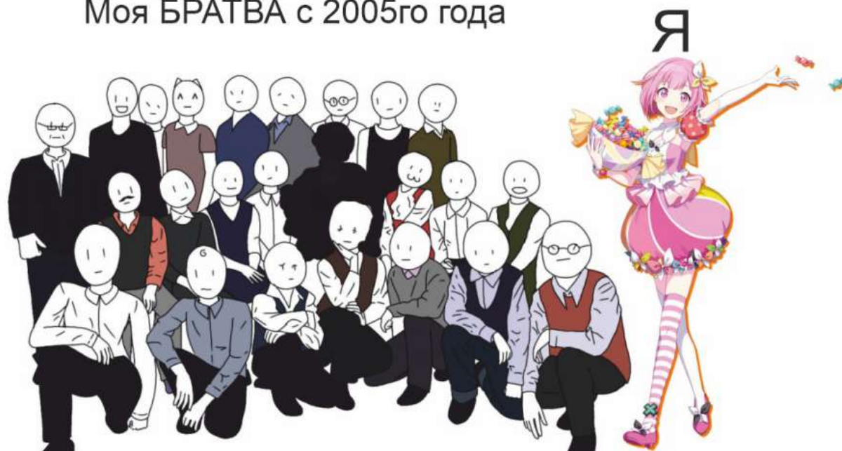
Автор: Багирова Лейла, 8Г